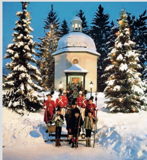
Iglesia Stille Nacht en Oberndorf

En Salzburgo, la cuna del villancico “Noche de Paz”, podemos visitar los numerosos monumentos que han sido testigos de la creación de esta canción. Nuestro nostálgico viaje en busca de las huellas de “Noche de Paz” nos lleva por las ciudades Salzburgo, Arnsdorf, Oberndorf, Hallein, Mariapfarr y Wagrain.