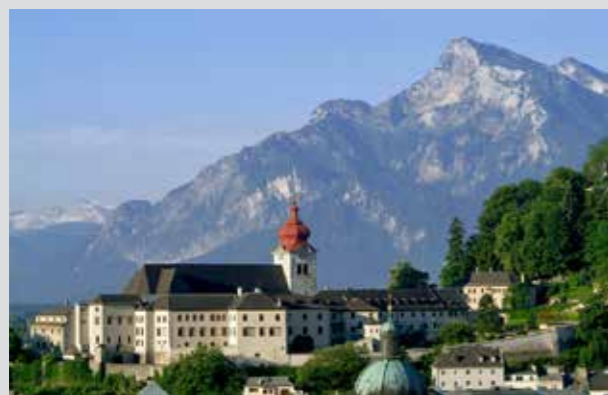
Monasterio en el Monte Nonnberg

Con sus dulces voces conquistaron los corazones de la gente y gracias a la película se convirtieron en leyendas: el recuerdo de la Familia von Trapp y de la película "Sonrisas y Lágrimas" en Salzburgo está más vivo que nunca.