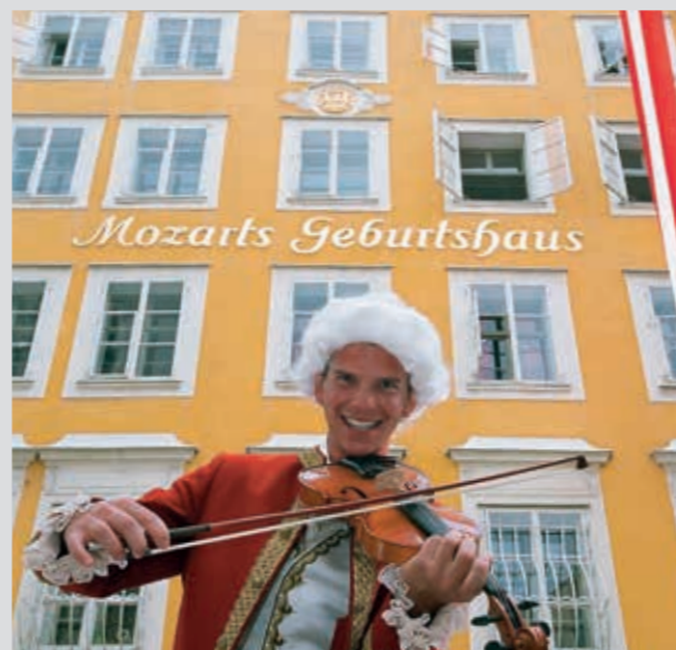
Casa Natal de Mozart

"Toda la belleza que he visto en otros lugares me parece poca en comparación con la hermosura celestial de la naturaleza de Salzburgo." Wolfgang Amadeus Mozart