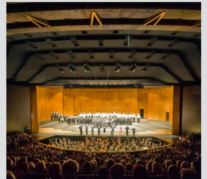
Concierto de Orquesta en la Gran Casa del Festival

Wolfgang Amadeus Mozart, el hijo más famoso de Salzburgo, ha marcado esta ciudad de manera especial. Entre los atractivos principales de la ciudad figuran su Casa Natal en la Calle Getreidegasse y la Vivienda de la Familia Mozart en la Plaza Makartplatz, además de los numerosos conciertos que interpretan su música. Aparte de Mozart, Salzburgo cuenta con un variado y distinguido programa cultural con más de 4.000 acontecimientos al año. Cabe destacar el Festival de Pascua, el Festival de Pentecostés, el Gran Festival de Verano, el Festival “Dialogue” en el Mozarteum, el Festival “Sommerszene”, el Festival de “Jazz and the City”, los Días de Cultura y los Conciertos de Adviento. El programa cultural que se ofrece se puede completar con visitas a los numerosos museos, galerías de arte, esculturas de arte plástico y exposiciones.