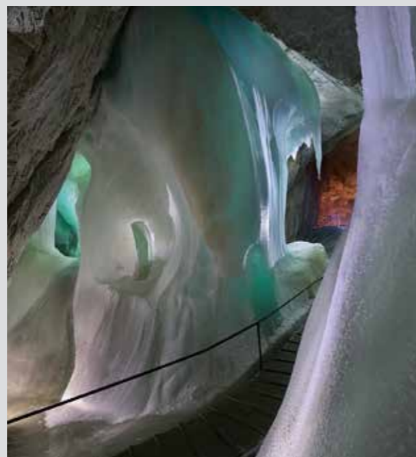
Formaciones de hielo en la Cueva de Hielo de Werfen

Salzburgo es singular en muchos aspectos. Entre los siete lugares de interés turístico más espectaculares figuran la carretera panorámica alpina más famosa de Europa, que sube al Monte Großglockner y la Cueva de Hielo más grande del mundo en Werfen.