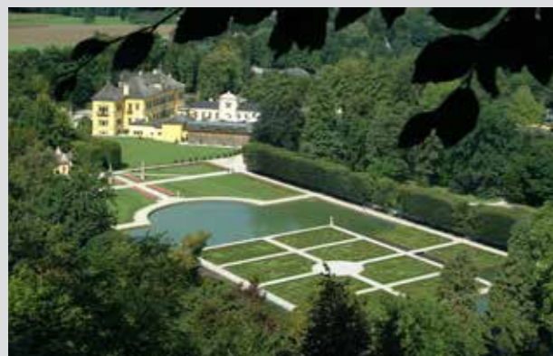
Castillo y Parque de Hellbrunn

Los arzobispos de Salzburgo sabían disfrutar de la vida. Esto lo podemos apreciar en el Castillo de Hellbrunn con sus románticos jardines, el parque zoológico y los Juegos de Agua. Aquí nos esperan numerosas sorpresas mientras la espectacular belleza de esta ciudad nos acompaña a cada paso.