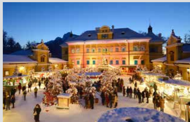
Mercado de Navidad „Hellbrunner Adventzauber“