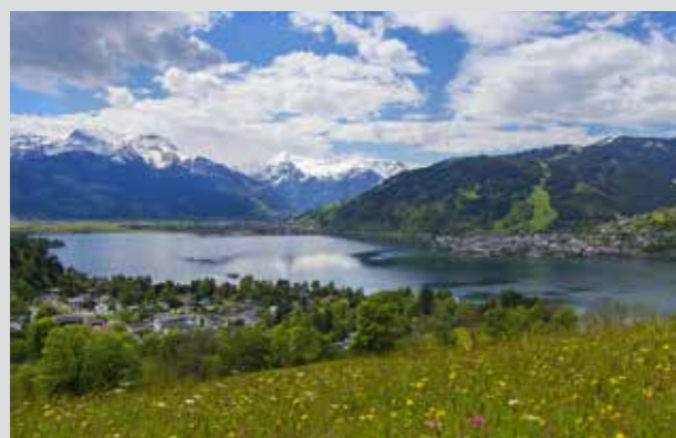
Vistas hacia Zell, el lago Zeller See y el Pico Kitzsteinhorn

Salzburgo es singular en muchos aspectos. Entre los siete lugares de interés turístico más espectaculares figuran la carretera panorámica alpina más famosa de Europa, que sube al Monte Großglockner y la Cueva de Hielo más grande del mundo en Werfen.