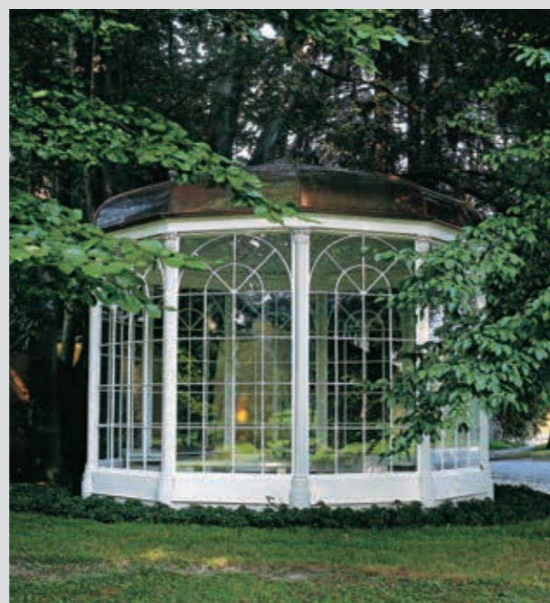
Pabellón de "The Sound of Music" en Hellbrunn

Con sus dulces voces conquistaron los corazones de la gente y gracias a la película se convirtieron en leyendas: el recuerdo de la Familia von Trapp y de la película "Sonrisas y Lágrimas" en Salzburgo está más vivo que nunca.