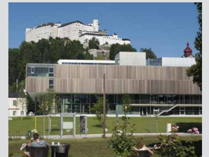
Universidad y Parque en el Barrio Nonntal

En Salzburgo conviven la tradición y la modernidad, como podemos comprobar con una simple mirada al Monte Mönchsberg, donde se alza la Fortaleza Hohensalzburg en una ladera y el Museo Contemporáneo en la otra. El contraste arquitectónico entre lo antiguo y lo moderno plasma la historia de esta ciudad y está presente en muchos lugares, donde los monumentos históricos conviven con obras de arte contemporáneo. Todos merecen una visita: el Aula Magna de la Universidad, el barrio museístico DomQuartier, la Gran Casa del Festival, la Casa para Mozart, el Mozarteum, el recorrido de arte contemporáneo „Walk of Modern Art“, con obras de Anselm Kiefer y Anthony Cragg, y el Hangar-7, con su magnífica colección de aviones y coches de carreras.