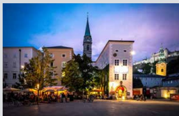
Museo de Arte Contemporáneo Rupertinum