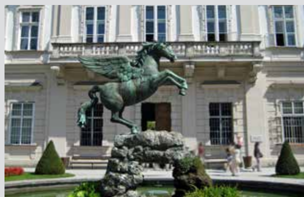
Fuente de Pegaso en los Jardines de Mirabell

"Edelweiß, Edelweiß, blanca flor de los Alpes, ..." Letra de la canción de Sonrisas y Lágrimas, Rogers y Hammerstein