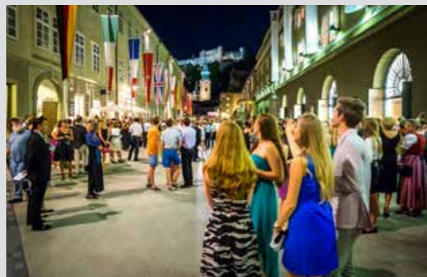
El „ambigü más bonito del mundo“