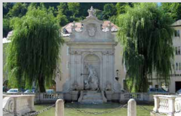
Abrevadero de Caballos "Kapitelschwemme"

"El hechizo del arte es el único enigma que no se basa en una superstición." Oskar Kokoschka