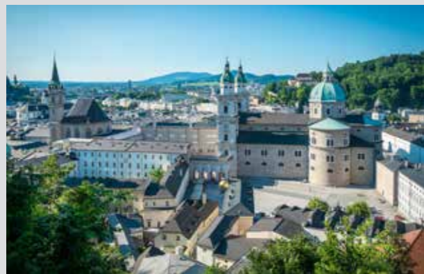
Barrio museístico DomQuartier Salzburg

Vistas hacia la Fortaleza de Hohensalzburg desde los Jardines de Mirabell