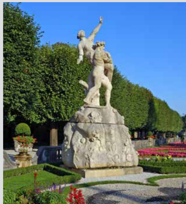
Jardines de Mirabell

La existencia de lujosos palacios barrocos junto a austeras obras de arquitectura contemporánea proporciona un ambiente interesante. Un paseo por la ciudad nos descubrirá detalles sorprendentes detrás de cada esquina.