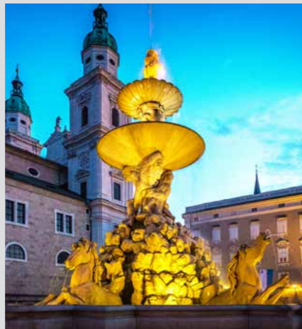
Fuente de la Residencia

"Para mí, las regiones de Salzburgo, Nápoles y Constantinopla figuran entre los lugares más espectaculares del mundo". Alexander von Humboldt.