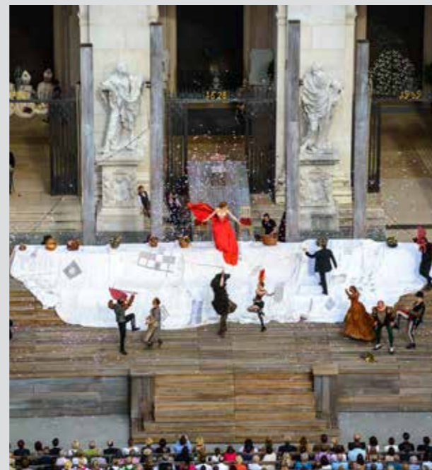
Jedermann en la Plaza de la Catedral

El Gran Festival de Salzburgo ha contribuido a la fama de esta ciudad. La obra “Jedermann” de Hugo von Hofmannsthal se estrenó por primera vez en 1920 y sigue siendo aún hoy una de las obras principales de este Festival. La podemos ver todos los años en la Plaza de la Catedral.