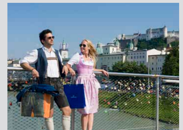
Candados de Amor en el Puente Makartsteg

Los pequeños placeres de la vida son tan importantes en Salzburgo como Mozart o el Gran Festival de Verano. Paseando por las estrechas callejuelas de su casco antiguo, el “Centro Comercial más bonito de Austria”, podremos empaparnos de todos los encantos de esta ciudad. Entre más de 900 establecimientos encontraremos tiendas de moda vanguardista y tradicionales y dulces recuerdos para los que se tuvieron que quedar en casa. No se quedará ningún deseo sin cumplir. Disfrute de un ambiente amistoso y de un cordial servicio en las famosas cafeterías, en alguno de los restaurantes tradicionales o en los templos gourmet de esta ciudad.