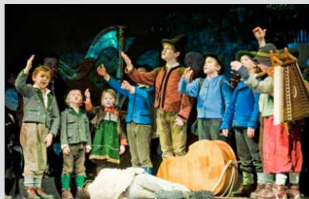
„Cantos de Adviento“ en la Gran Casa del Festival

En Salzburgo, la cuna del villancico “Noche de Paz”, podemos visitar los numerosos monumentos que han sido testigos de la creación de esta canción. Nuestro nostálgico viaje en busca de las huellas de “Noche de Paz” nos lleva por las ciudades Salzburgo, Arnsdorf, Oberndorf, Hallein, Mariapfarr y Wagrain.