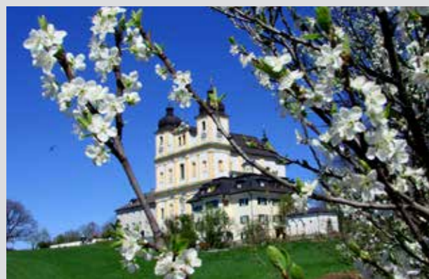
Iglesia de Peregrinaje Maria Plain

Vistas sobre Salzburgo desde Maria Plain