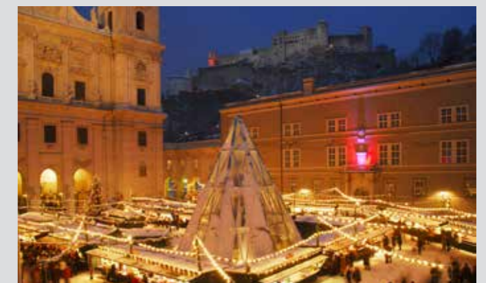
Mercado de Navidad „Salzburger Christkindlmarkt“ en la Plaza de la Catedral

Parque Volksgarten. En Fin de Año la ciudad se convierte en una enorme sala de fiestas con música y espectáculos por todas las plazas de la ciudad.