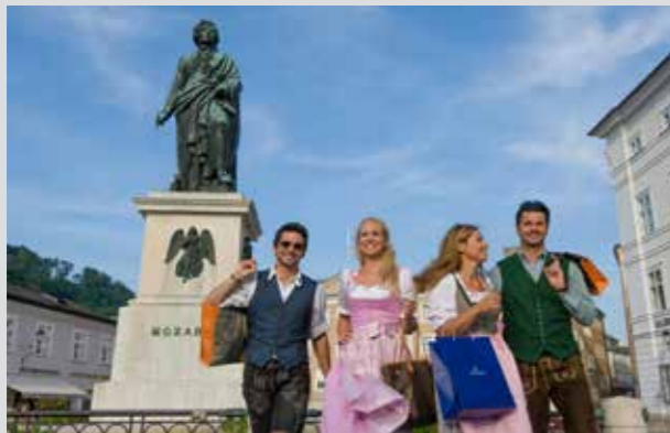
Estatua de Mozart en la Plaza de Mozart

El encanto especial del conjunto histórico-artístico de Salzburgo y los numerosos monumentos culturales de esta ciudad contribuyeron a que la UNESCO declarara el Casco Antiguo de Salzburgo Patrimonio Cultural de la Humanidad en 1997. La belleza de esta ciudad perdurará para el disfrute de futuras generaciones.