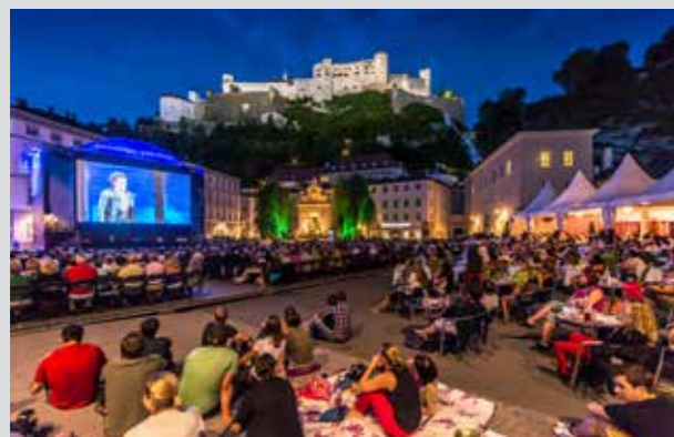
Siemens „Noches del Festival“, ópera en la gran pantalla

El Gran Festival de Salzburgo ha contribuido a la fama de esta ciudad. La obra “Jedermann” de Hugo von Hofmannsthal se estrenó por primera vez en 1920 y sigue siendo aún hoy una de las obras principales de este Festival. La podemos ver todos los años en la Plaza de la Catedral.